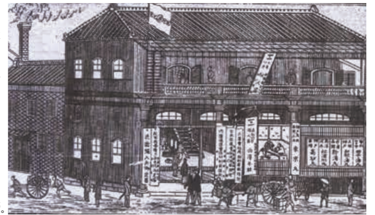
西澤旅館 停車場近くにあった当時の旅館。

銀座は新橋停車場に近く、役所の多い丸の内方面へ行くのにも、問屋街の日本橋方面へ行くのにも便利だった。そのため多くの旅館ができた。