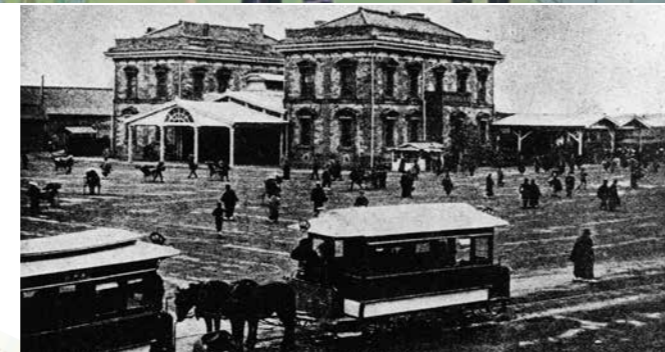
新橋停車場 日本最初の鉄道の起点。日本の鉄道事業はイギリスのしくみをまねて行われた。開通当時につかわれた汽車はイギリスから輸入されたもので、運転士もイギリス人だった。