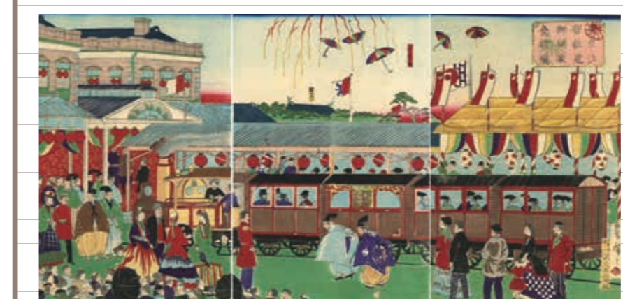
新橋で行われた開業式のようす。

1872(明治5)年10月14日、新橋～横浜間の鉄道開業式が行われた。鉄道事業は殖産興業の政策を実現するために、明治政府が進める大いなる事業で、国家規模で進められた。開業式はたいへん大がかりな式典で、国内外の上流階級の人々や明治天皇もまねいて、新橋と横浜の両停車場で盛大に行われた。